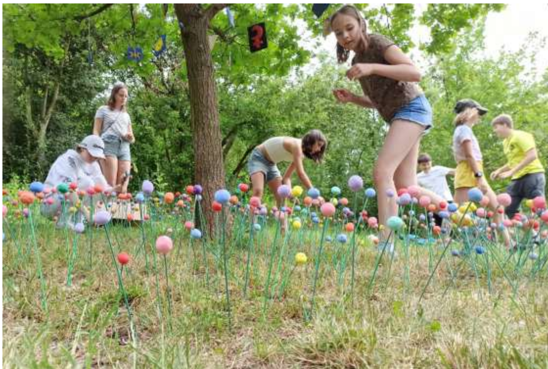
Land art v Centrálním parku (v rámci akce Rozloučení se školou)

Zajímavou zkušeností byla akce Rozloučení se školou, kterou tradičně pořádá MČ Praha 13, kam tentokrát přispěli žáci 6. ročníku výtvarnou tvorbou v krajině (tzv. land artem). Třída VI.A pojala instalaci jako symbolické propojení proměnlivého života na Zemi (víření barevných bodů v trávě) a toho, co nás přesahuje nebo je nám vzdálené, až nedosažitelné (planety a božstva v koruně stromu).