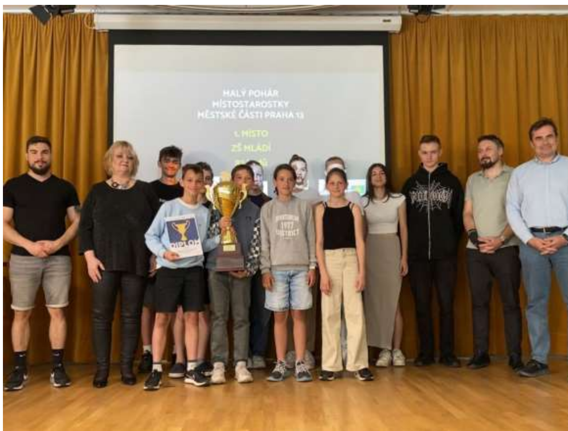
Slavnostní předávání pohárů na Radnici MČ Praha 13

Rovněž sportovní turnaje, na kterých žáci reprezentují naši školu, se každoročně těší veliké oblibě. Zájem o účast na nich je tudíž velmi vysoký. U nás na Praze 13 zaštiťuje tyto soutěže Dům dětí a mládeže Stodůlky, který soutěže v jednotlivých sportovních disciplínách organizuje během celého školního roku. Jedná se o celý seriál bodovaných sportovních klání o Velký pohár starosty Městské části Praha 13 (pro žáky 2. stupně) a Malý pohár místostarostky Městské části Praha 13 (pro žáky 1. stupně). Vše vyvrcholí závěrečným ceremoniálem s vyhlášením výsledků za celý školní rok. V obou kategoriích byli naši žáci mimořádně úspěšní. Ceremoniál se letos konal 5. června 2024 v Obřadní síni Úřadu Městské části Praha 13. Jsme velice potěšeni, že máme ve škole velice šikovné žáky se sportovním nadáním. V hodinách tělesné výchovy se na veškeré sportovní akce snažíme připravit a nenechat nic náhodě. Z pohledu učitelů tělesné výchovy pak vyvstává nelehký úkol vybrat vhodné talentované žáky, kteří by dohromady utvořili co možná nejlepší tým. Tento přístup přinesl své ovoce a naši sportovci si letos převzali pohár za 1. místo v kategorii prvního stupně (tzv. Malý pohár ) a o kousek menší ocenění pro žáky druhého stupeň (tzv. Velký pohár ) za skvělé 2. místo .