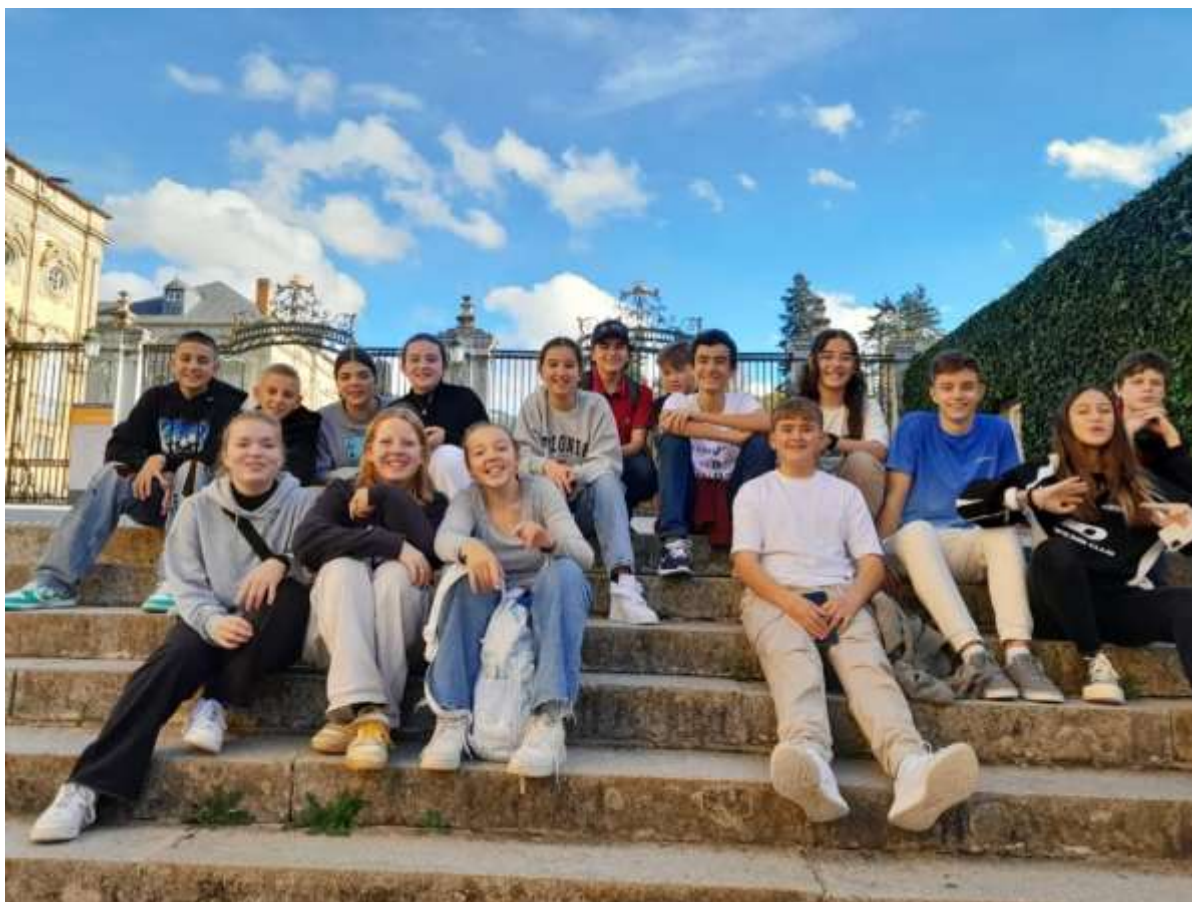
Z cesty po Španělsku v rámci projektu Erasmus+

Škola realizovala projekt Erasmus+ nazvaný „ Cesty ke školní mini-společnosti “, ve kterém na základě zkušeností z další základní školy z MČ Praha 13 a škol ve Francii a Španělsku našla vlastní cesty k posilování zapojení žáků do školního života. Škola obnovila školní parlament (Žákovskou radu). V rámci projektu jsme hostili skupinu žáků ze Španělska, v dalším školním roce plánujeme přijmout skupinu z Francie.