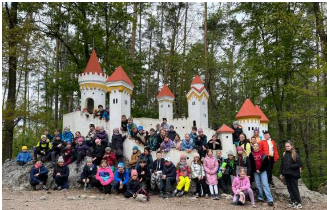
Z výletu na Škole v přírodě s angličtinou

sportování nebo i stolování. Za soutěže dostali žáci kromě odměn také dvojjazyčné anglicko-české diplomy.