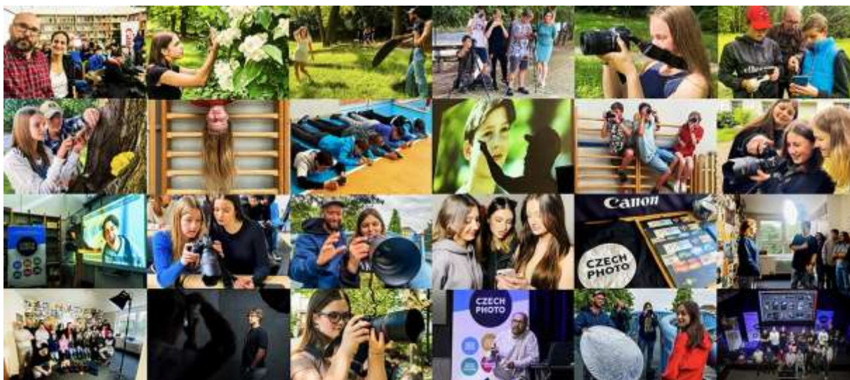
Z projektu Necvakejte, foťte realizovaným ve spolupráci z Czech Photo

Od září 2022 pravidelně spolupracujeme se společností Czech Photo o.p.s, která má sídlo v MČ Praha 13 a je veřejnosti známá například pořádáním soutěží Czech Press Photo. Žáci naší školy mají možnost zapojit se do velmi zajímavého projektu s názvem „Necvakejte, foťte!“: Hlavním organizátorem akce byla již zmíněná společnost, která podporuje fotografii již více než čtvrtstoletí, je platformou, která si klade za cíl zvýšení mediální a vizuální gramotnosti také u dětí a mládeže. Mezi tváře akce patří řada známých osobností, které se sami zabývají fotografií (např. Hynek Čermák, Petr Burkner, Lukáš Fritscher nebo Honza Homola). V naší škole proběhly již tři fotografické workshopy, kterých se účastnili zájemci o fotografování, pokročilí i začátečníci z 2. stupně naší školy. Žáci se v rámci projektového dne naučili, jak vypadá fotografie, která promlouvá, a jak takovou pořídit. Součástí programu byla i dovednost naučit se rozlišovat kvalitní fotografické zpravodajství, bulvár, nebo i fakenews. Rozhodně nejvíce žáky bavilo samotné fotografování ve dvou dílnách – reportážní foto a portrét. V závěru akce proběhlo i vzájemné vyhodnocení, předání drobných cen a možnost okamžitého tisku fotografií v profesionálním mobilním stánku CEWE. Skvělými průvodci žáků i učitelů byli profesionální fotografové Dan Materna a Oldřich Drnec. Všem fotografům a zapojeným pracovníkům z Czech Photo patří obrovský dík za skvělou realizaci projektu.